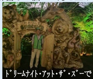
ドリームナイト・アット・ザ・ズーで

ドリームナイトで感謝されたことを糧に、わかりやすいガイドを心がける一方、入会説明会での勧誘や、他Grとの掛け持ちも奨励し増員を図りたいと思います。