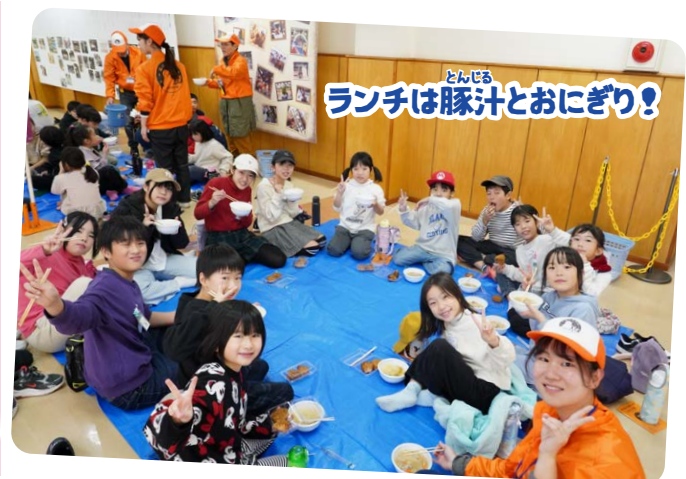
ランチは豚汁とおにぎり！

「俳句っぽい言葉を見つけるのがむずかし かったです。他の子の句がすごい！」 「自分と同じものを見て作っても、ちがう句 になるのがおもしろいです！」