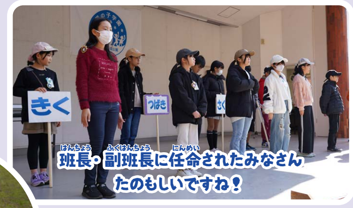
班長・副班長に任命されたみなさん たのしいですね！